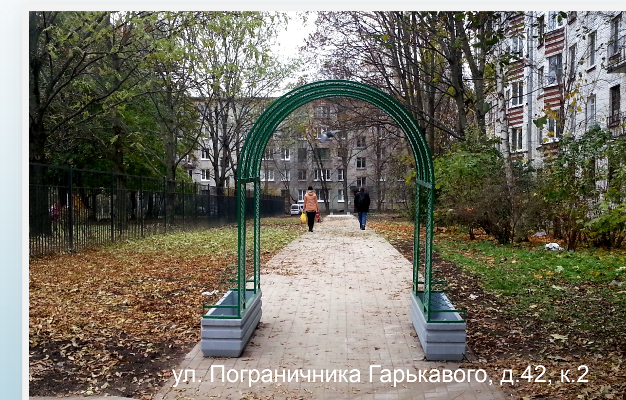
ул. Пограничника Гарькавого, д.42, к.2

ул. П Гарькавого, д.39; ул. Здоровцева, д. 35, к.1; пр. Н.Ополчения, д.241,к.5; пр. Ветеранов, 166; ул. Тамбасова, д.36, к.1-2.