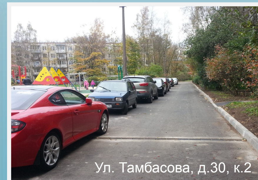
Ул. Тамбасова, д.30, к.2