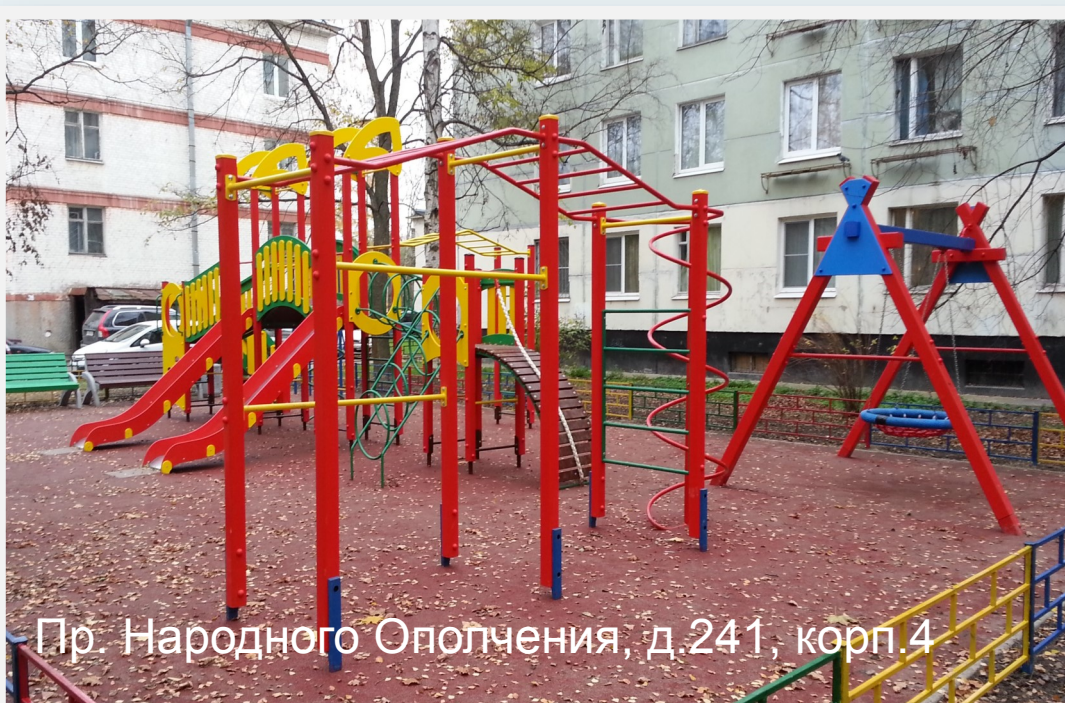
Пр. Народного Ополчения, д.241, корп.4