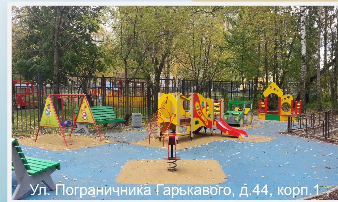
Ул. Пограничника Гарькавого, д.44, корп.1