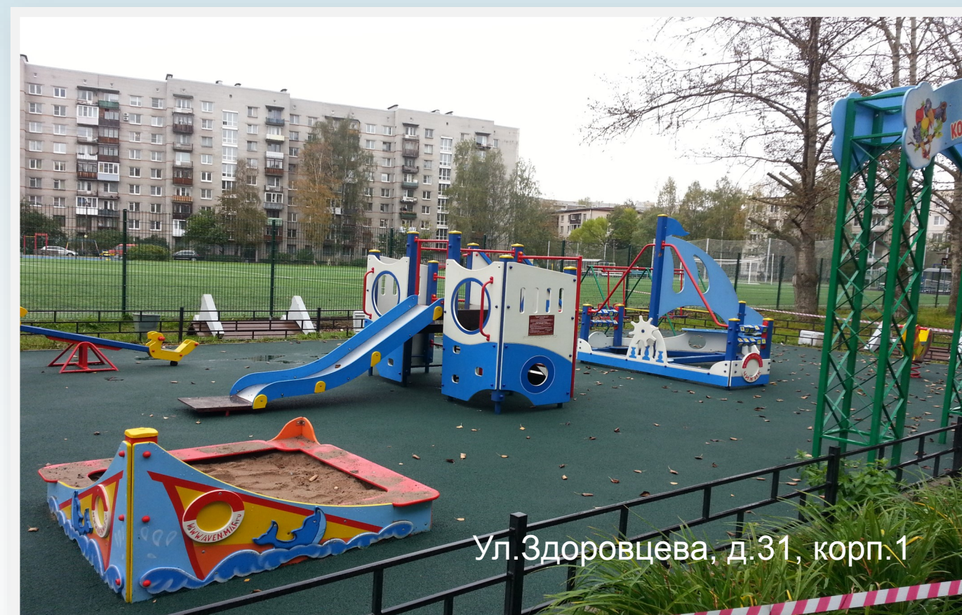
Ул.Здоровцева, д.31, корп.1

Площадь резинового покрытия составила 1037,06 кв.м.