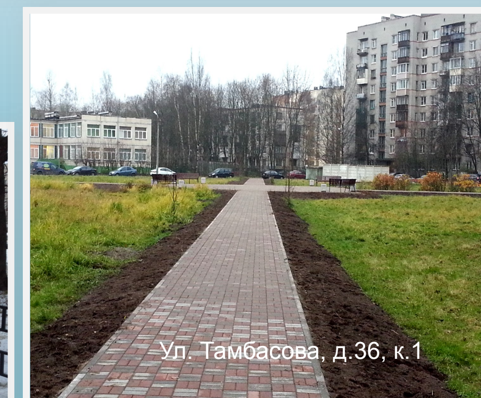
Ул. Тамбасова, д.36, к.1