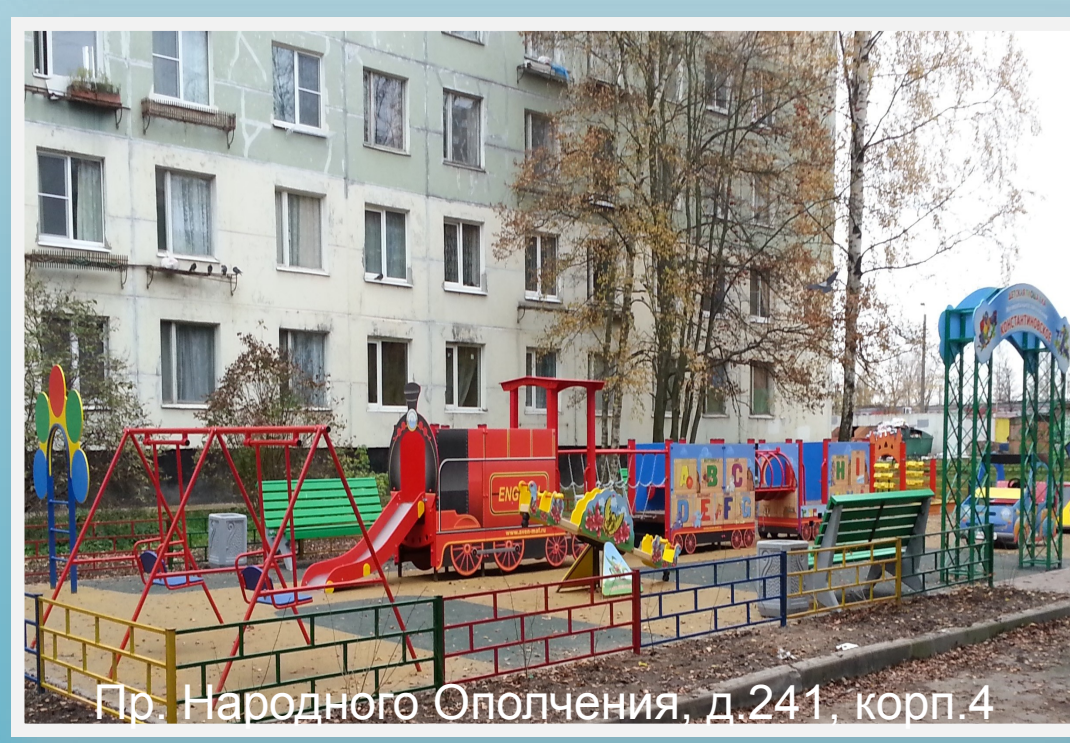
Пр. Народного Ополчения, д.241, корп.4