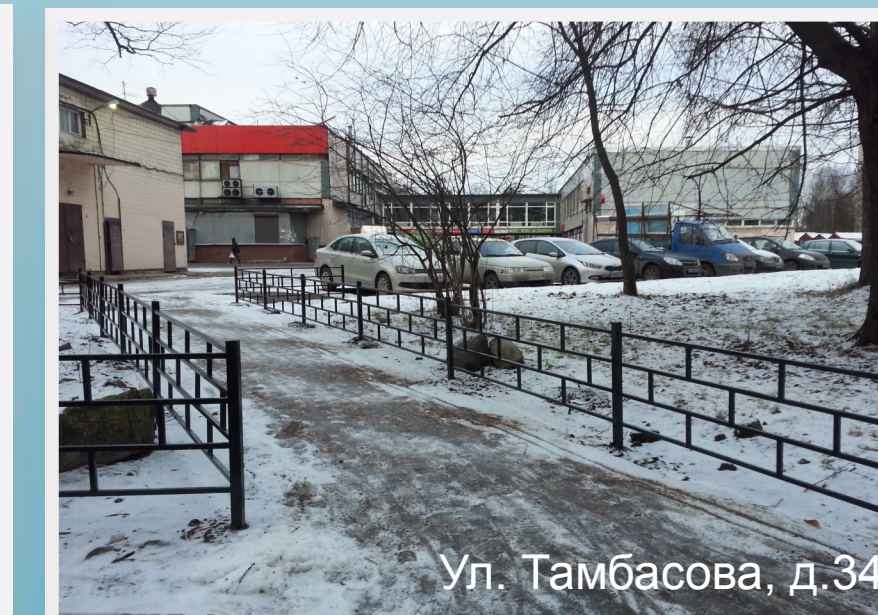
Ул. Тамбасова, д.34