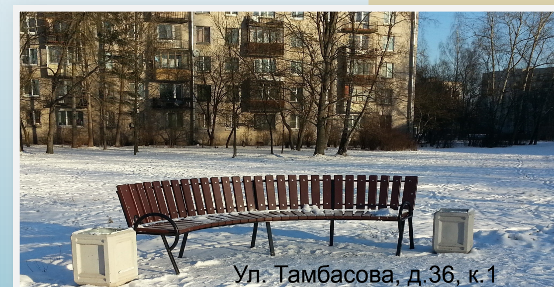
Ул. Тамбасова, д.36, к.1