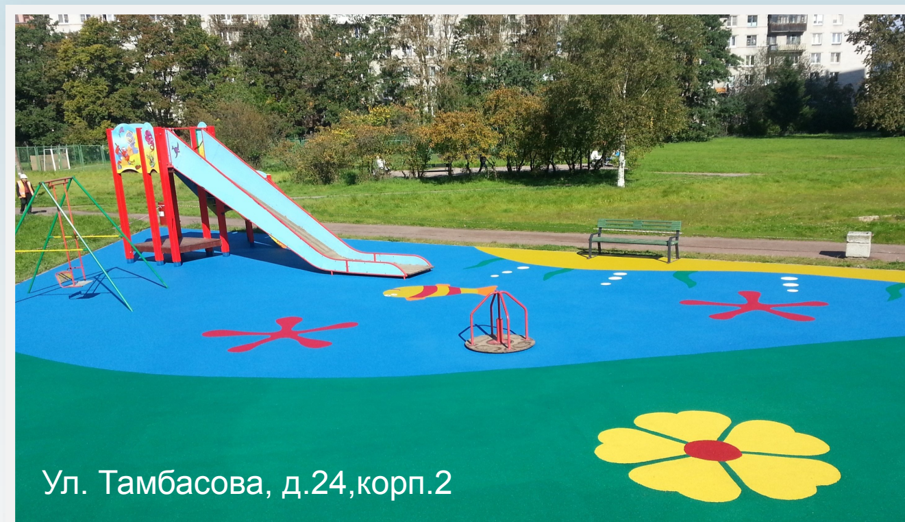
Ул. Тамбасова, д.24,корп.2

ул. П.Гарькавого, д. 38, к.1; пр. Ветеранов д.152, к.3; пр. Н.Ополчения, д. 241, к.2; ул. Тамбасова д. 34, пр.Ветеранов д.152,корп. 4-5; ул. 2-я Комсомольская, д. 49.