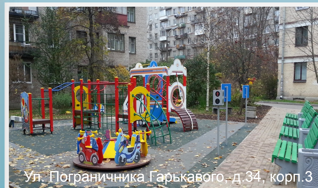
Ул. Пограничника Гарькавого, д.34, корп.3